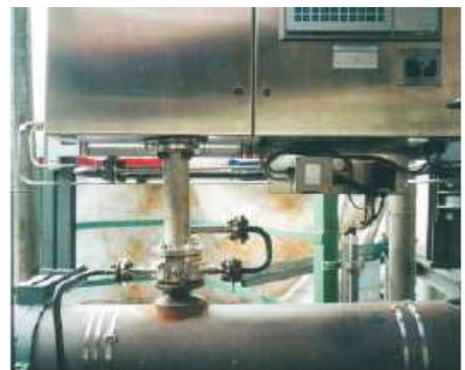
Нет пробоотборных линий